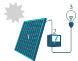
1. Zonnepaneel | 2. Omvormer | 3. Elektrische toestellen

Om de zonnepanelen optimaal te laten renderen, plaatst u ze tussen oostelijke en westelijke richting onder een hoek van 20° tot 60°.