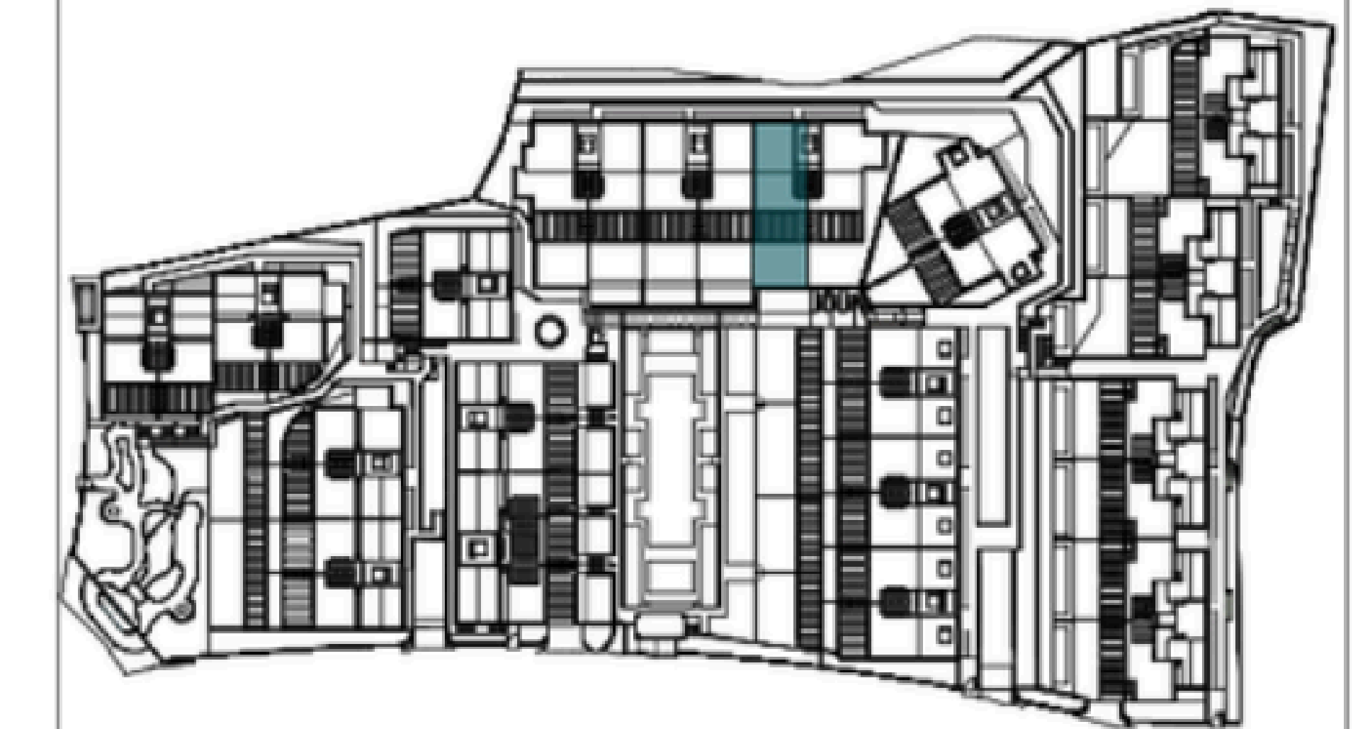
EMPLAZAMIENTO. SITUACIÓN POR PORTAL VIV 10.0.A