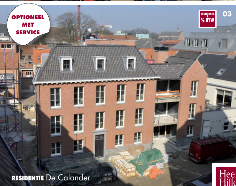
RESIDENTIE De Calander