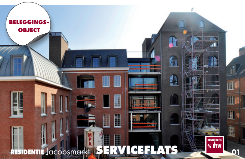
RESIDENTIE Jacobsmarkt SERVICEFLATS

04 OUD-TURNHOUT . Va. 428.400 Dorp 6 . Ref 01/2239 Nieuwbouwproject van 3 luxe appartementen met 3 slpks in het centrum. Nog 2 app. te koop!